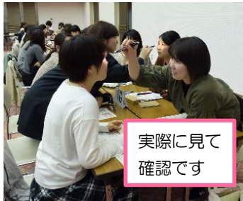
実際に見て確認です

5月9日に主に卒業1年目看護師を対象の研修【055】が開催されました。新人看護師にとっては入社して約1ヶ月、さらなるケアの知識と継続した学習の必要性をヒシヒシと