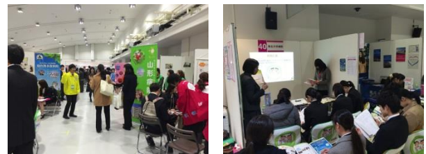
説明会の様子です

今後も院内で開催する病院見学会やオープンホスピタルも継続していきます。平成 29 年度もたくさんの新人さんをお迎えできるように、看護部一丸となってがんばっていきましょう！