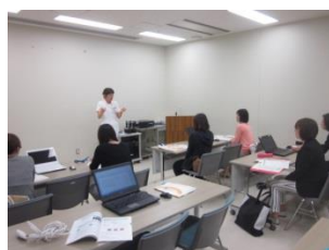
オリエンテーションの様子