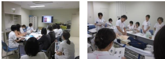
◆◆部署の勉強会にもおじゃましました◆◆

部署のラウンドを通じて、教育に関する質問をお受けし、看護部の教育と部署の教育をつなげていきたいと思っています。部署の師長さんをはじめスタッフの皆さん、これからもよろしくお願ひします。